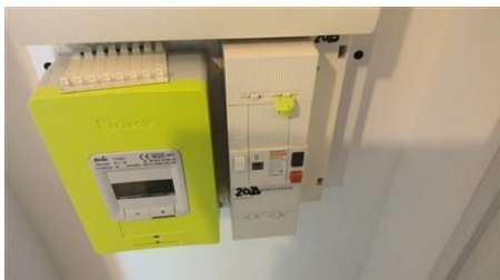
Photo du Compteur électrique

Règles élémentaires de sécurité et d'usage à respecter (liste non exhaustive)